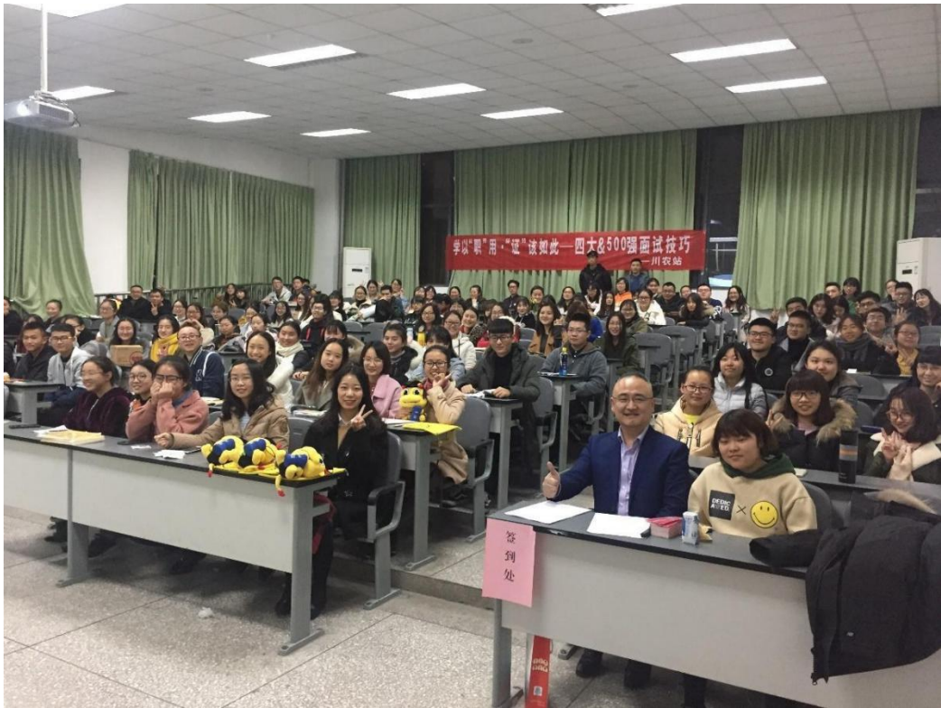
FRM 学员学习“500 强企业”面试技巧