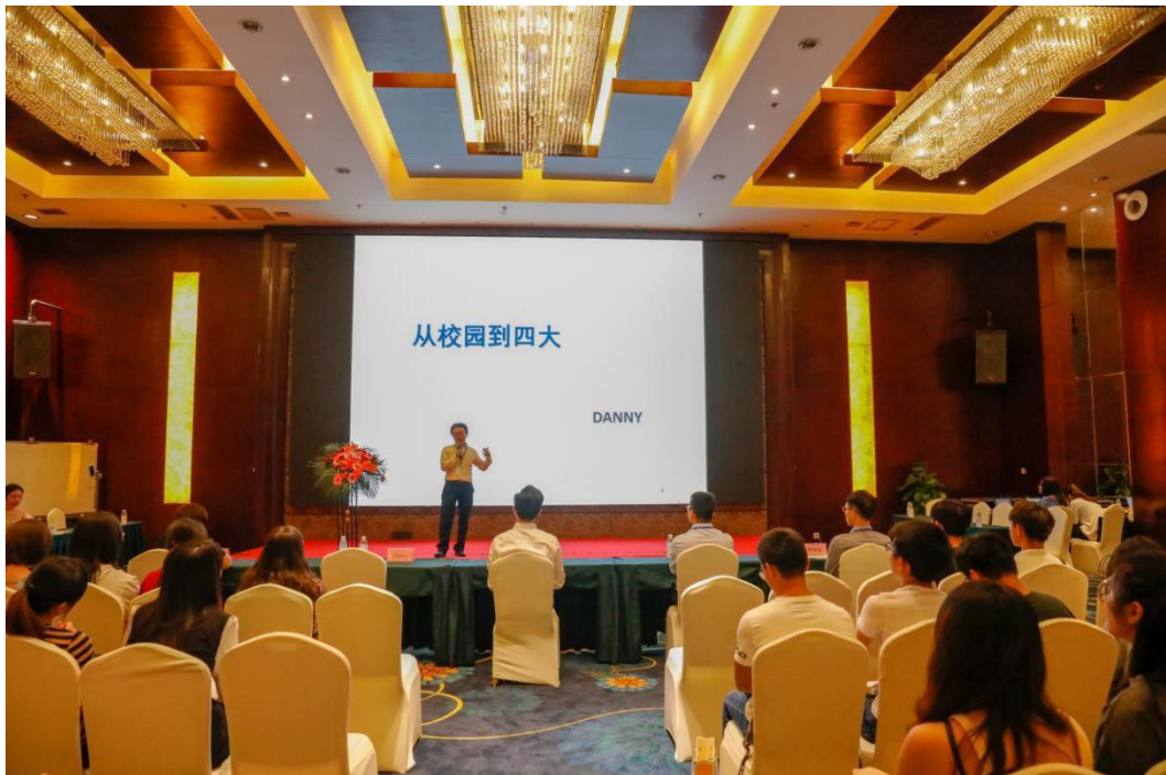
FRM 学员参加行业大咖论坛