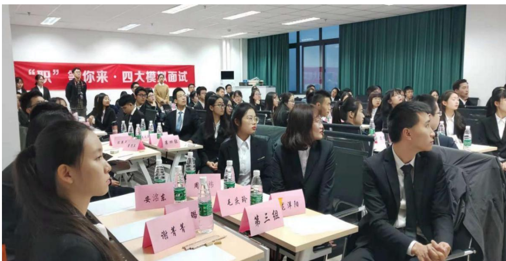
FRM 学员全真模拟面试